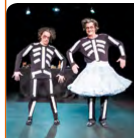
Theater Fata Morgana

Die jüngste Tochter der Zirkusfamilie Zampano wird von allen nur belächelt, weil sie seit Jahren daran scheitert, die tägliche Show um einen kleinen Auftritt zu bereichern. Aber dann... Eintritt: € 2,-